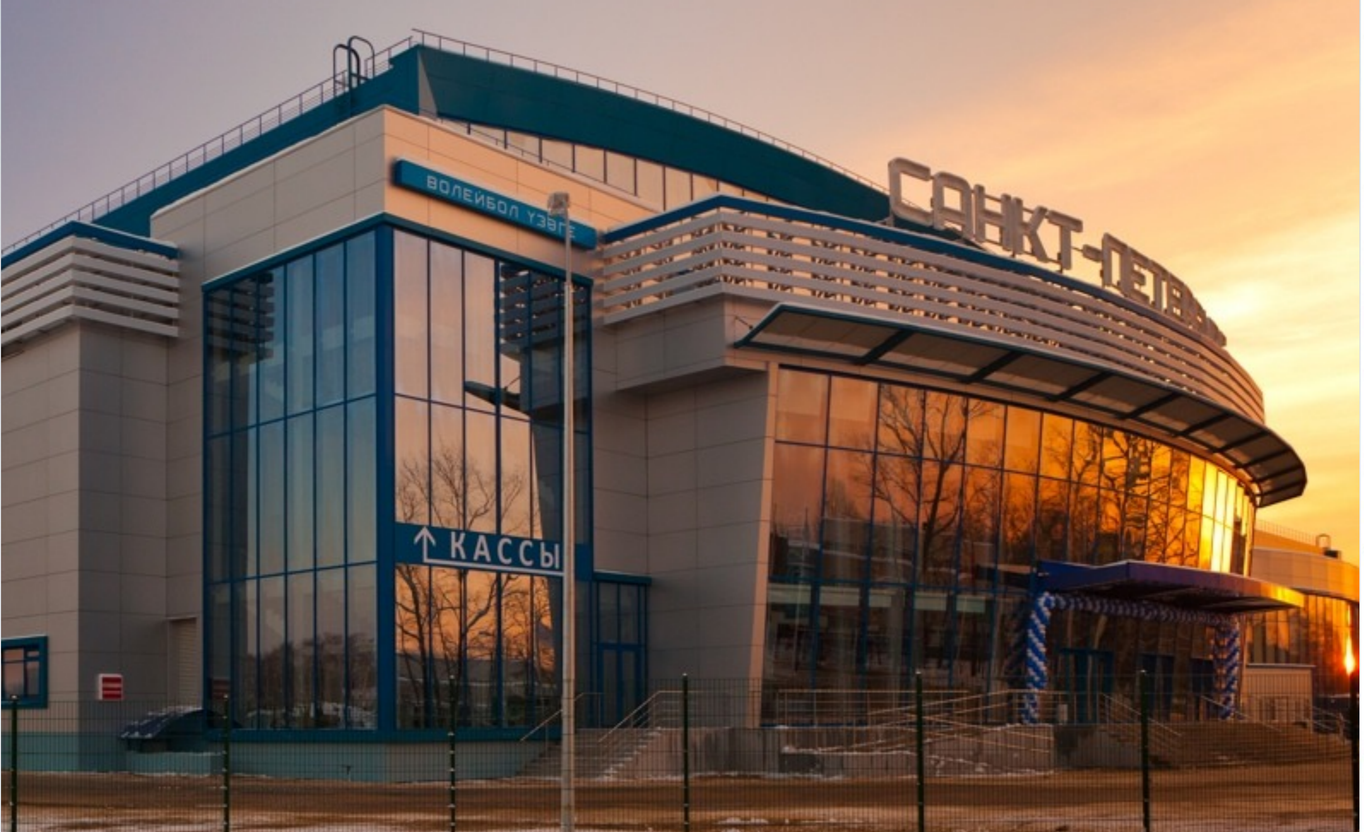
Центр волейбола «Санкт-Петербург»