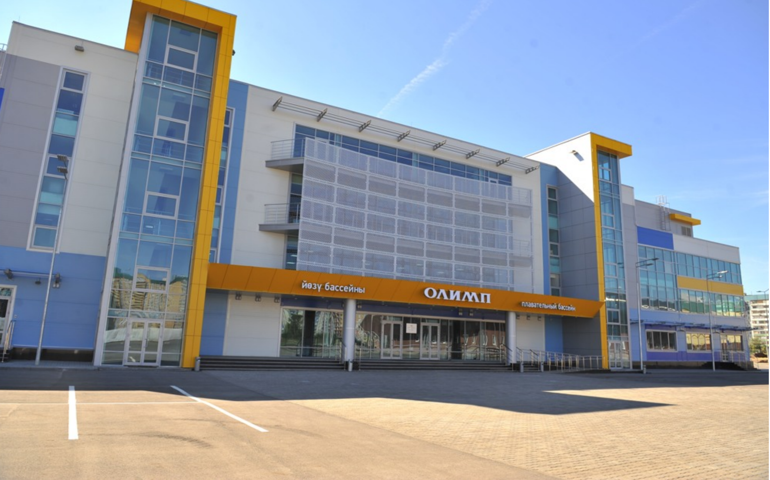
Спортивный комплекс Олимп КГТУ им.А.Н.Туполева