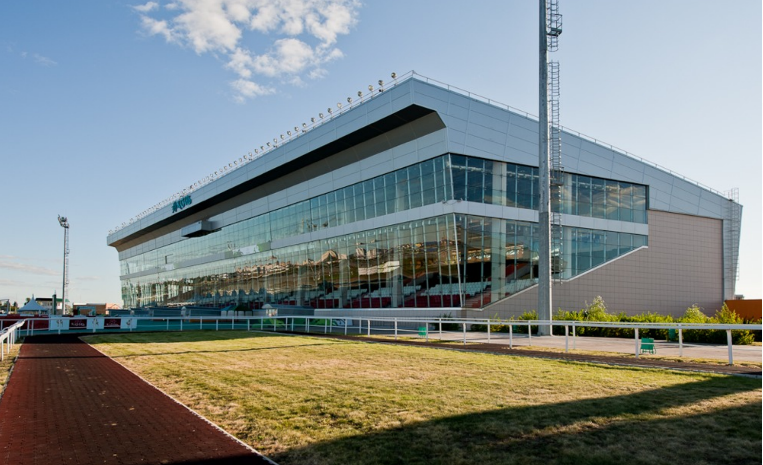
Международный конно-спортивный комплекс «Казань»