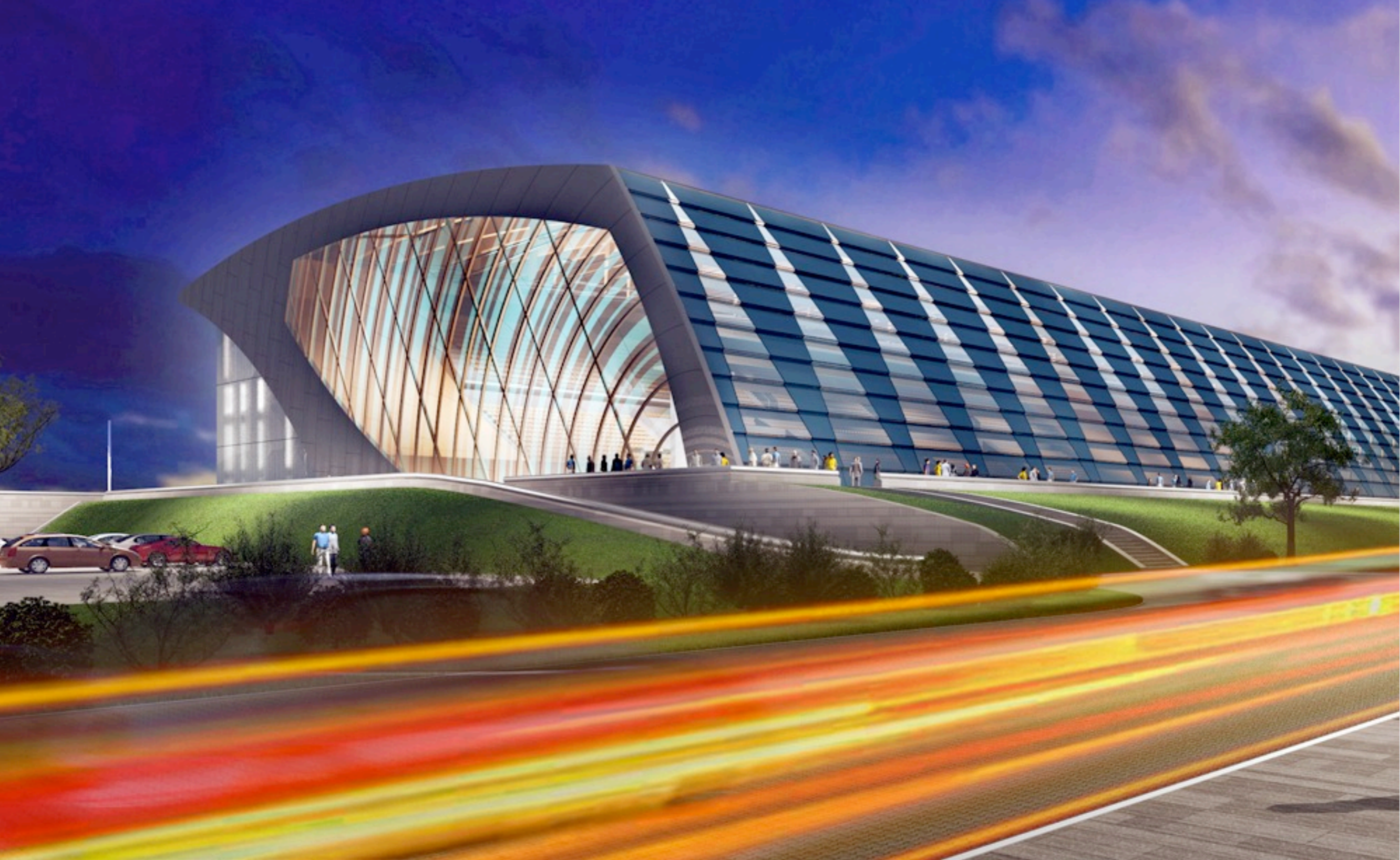
Дворец водных видов спорта