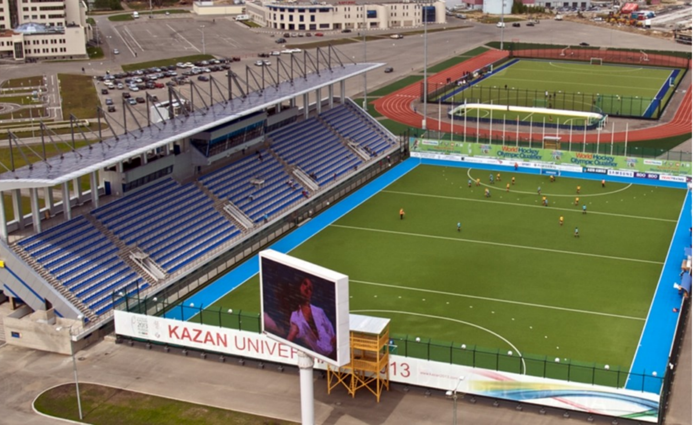
Центр хоккея на траве