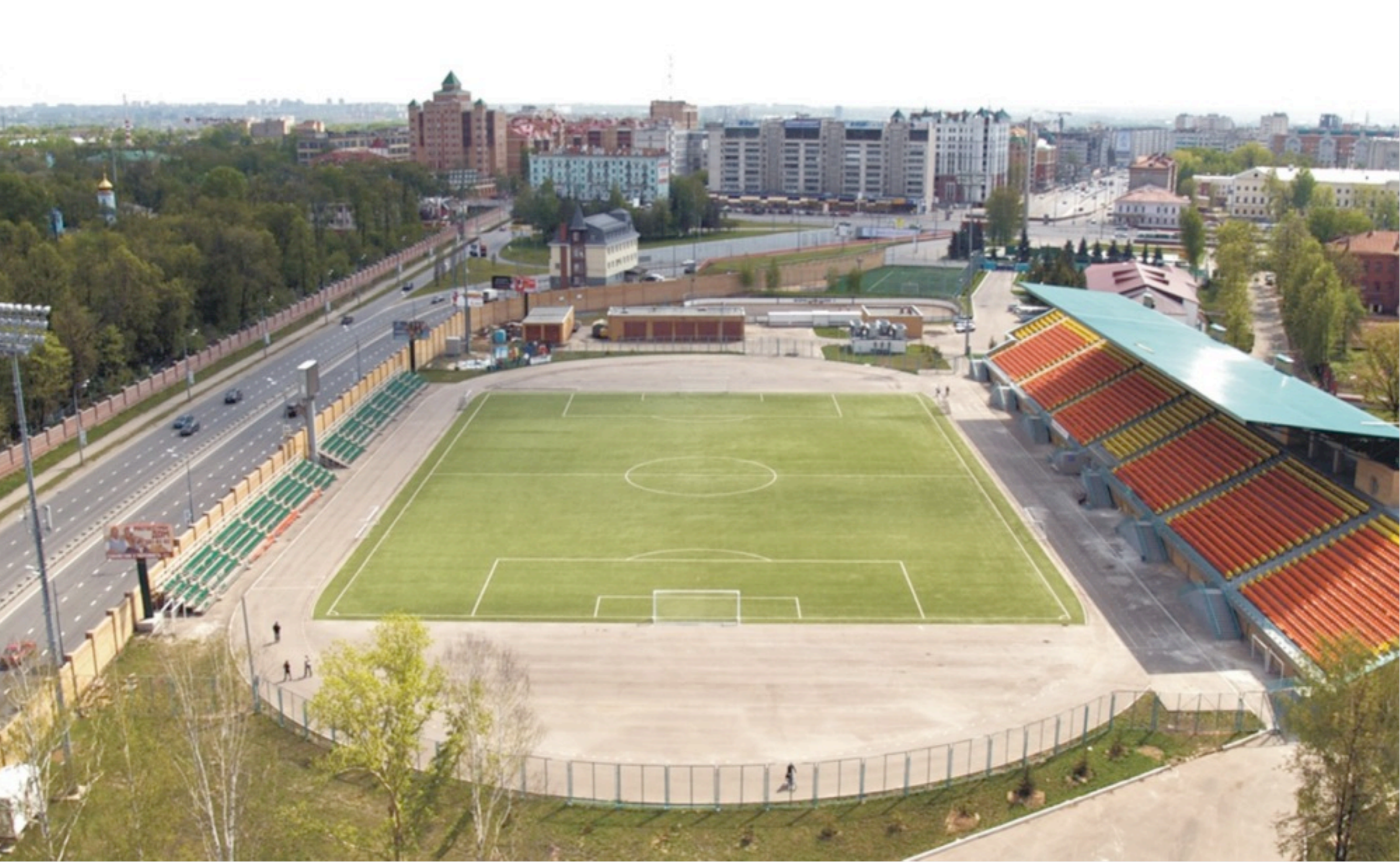
Стадион «Трудовые резервы»