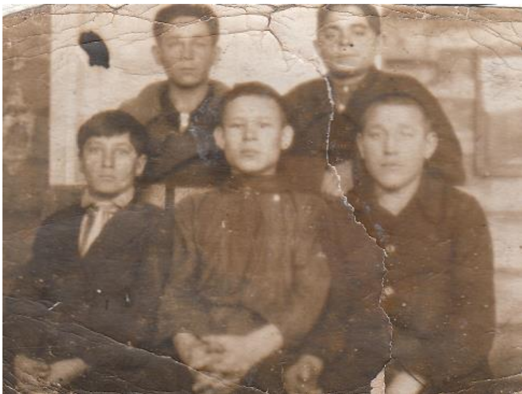
Учащиеся Каргалинской школы, 1938 год