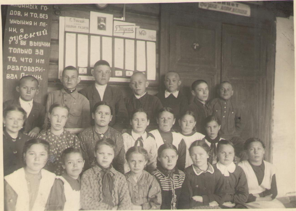
Эрзбидят тугъроге класнары (1953-54 уку елде)