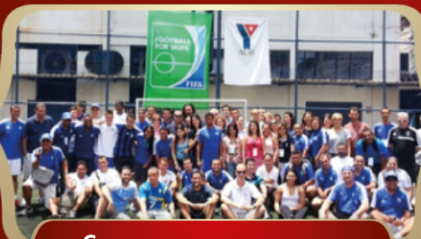
Социальные программы и развитие знаний