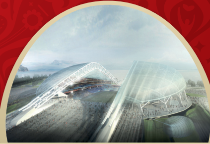
СТАДИОН ФИШТ СОЧИ