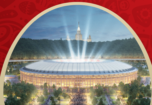
СТАДИОН ЛУЖНИКИ МОСКВА