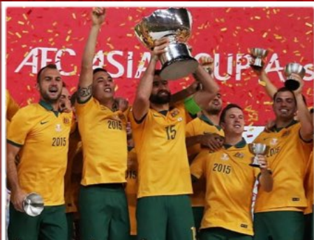
СБОРНАЯ АВСТРАЛИИ ОБЛАДАТЕЛЬ КУБКА АЗИИ