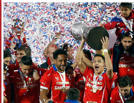
СБОРНАЯ ЧИЛИ ОБЛАДАТЕЛЬ КУБКА АМЕРИКИ