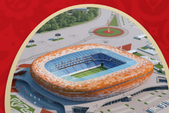
МОРДОВИЯ АРЕНА САРАНСК