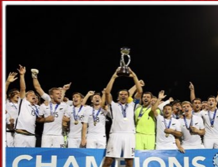
СБОРНАЯ НОВОЙ ЗЕЛАНДИИ ОБЛАДАТЕЛЬ КУБКА НАЦИЙ ОКЕАНИИ