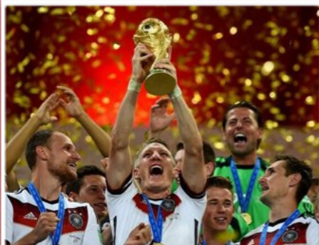
СБОРНАЯ ГЕРМАНИИ ЧЕМПИОН МИРА