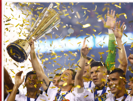
СБОРНАЯ МЕКСИКИ ПОБЕДИТЕЛЬ КУБКА СЕВЕРНОЙ И ЦЕНТРАЛЬНОЙ АМЕРИКИ