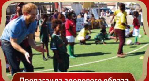
Пропаганда здорового образа жизни и спорта