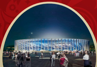
СТАДИОН НИЖНИЙ НОВГОРОД