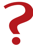
ПОБЕДИТЕЛЬ КУБКА АФРИКАНСКИХ НАЦИЙ CAF 2017