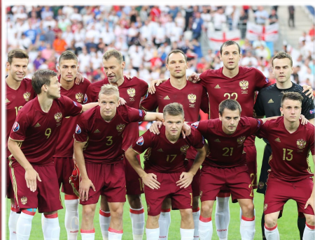
СБОРНАЯ РОССИИ СТРАНА-ОРГАНИЗАТОР