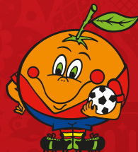
Наранхито Испания, 1982