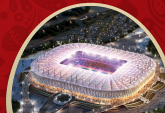
РОСТОВ АРЕНА РОСТОВ-НА-ДОНУ