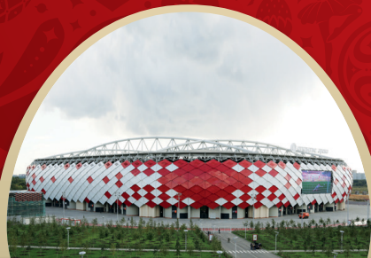
СТАДИОН СПАРТАК МОСКВА