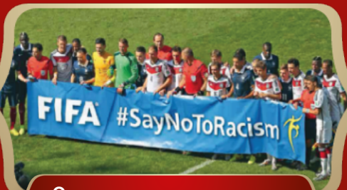
Отсутствие дискриминации и проявлений расизма