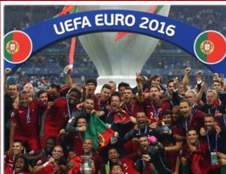
СБОРНАЯ ПОРТУГАЛИИ ПОБЕДИТЕЛЬ ЧЕМПИОНАТА ЕВРОПЫ